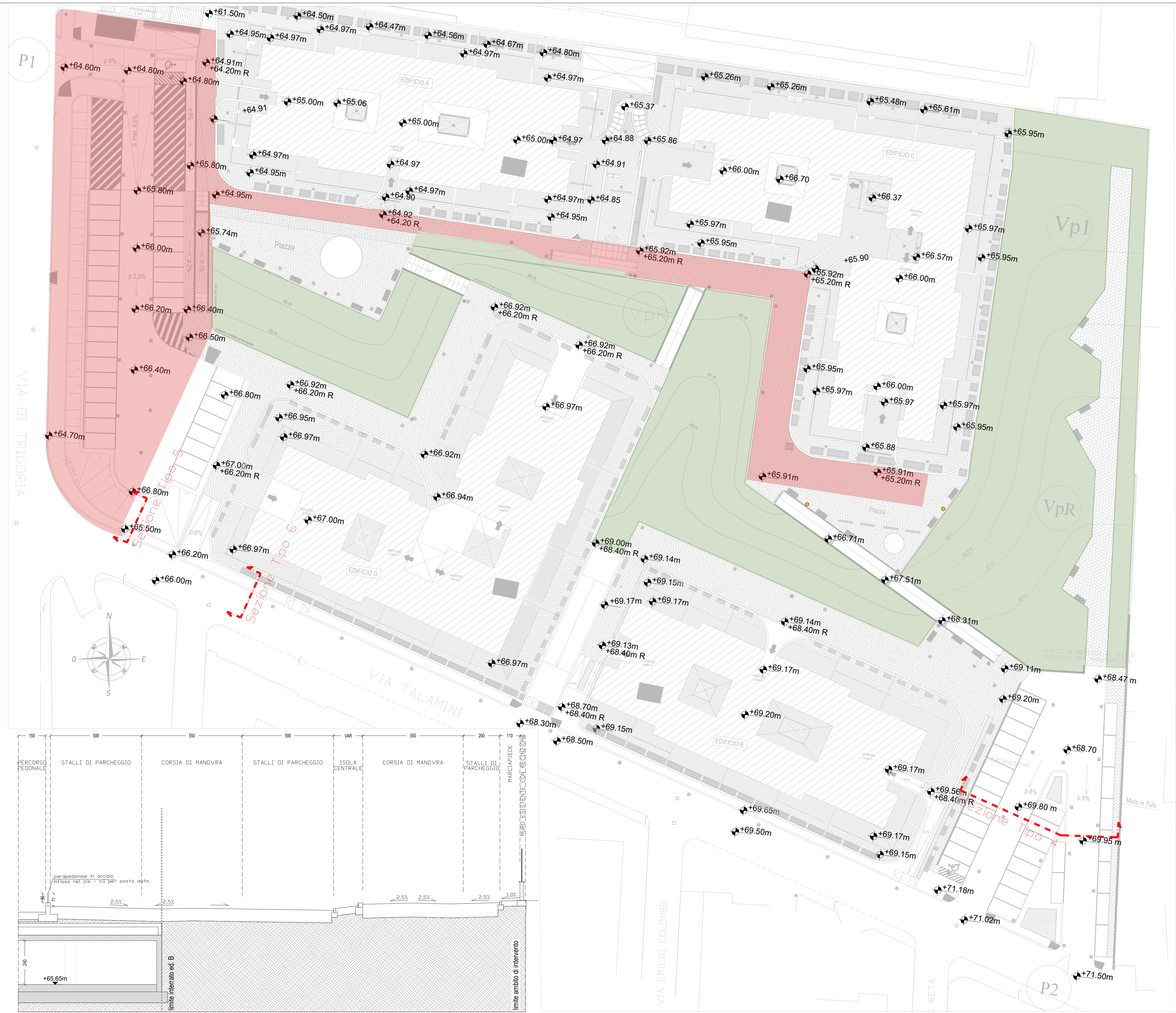
SEZIONE TIPO 4 (Scala 1:100)